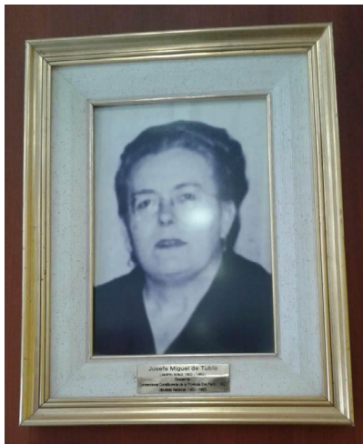
EPET N.º 9 Josefa Miguel de Tubío - Jacinto Arauz, La Pampa.