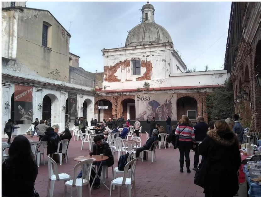
Imagen de la Cárcel de Mujeres de San Telmo ubicada en Humberto 1° N.º 378, tomada en julio de 2019. Actualmente, se usa como museo y se realizan peñas folklóricas.

Además, Josefa se encuentra incluida entre los acusados por traición a la Patria en el juicio titulado “Perón, Juan D. y otros”. En el documento encontrado dice: