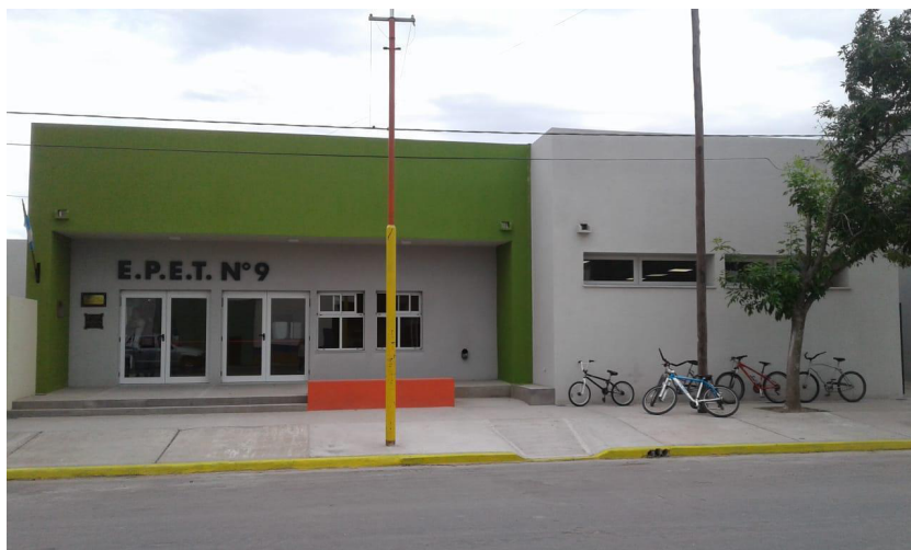
EPET N.º 9 Josefa Miguel de Tubío - Jacinto Arauz, La Pampa.